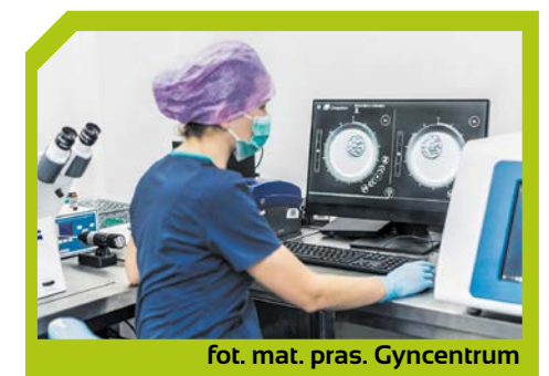
fol. mat. pras. Gyncentrum

Światowa Organizacja Zdrowia zalicza niepłodność do chorób cywilizacyjnych. W Polsce dotkniętych jest nią ok. 1,5 miliona par i liczba ta stale rośnie. To cena, jaką płacimy za postęp technologiczny – problem niepłodności to przede wszystkim problem krajów wysoko rozwiniętych. Wśród przyczyn wymienia się złą dietę, przewlekły stres, brak aktywności fizycznej oraz zanieczyszczenie środowiska. Problem z poczęciem dziecka może leżeć po obu stronach, tj. po stronie kobiety, po stronie mężczyzny lub obojga jednocześnie.