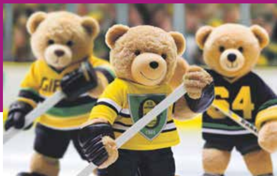
fol. mat. prasowe

W NIEDZIELĘ, 28 STYCZNIA, W KATOWICKIEJ SATELICIE ODBYWA SIĘ AKCJA „DORZUC MISIE” ORGANIZOWANA PRZEZ FUNDACJĘ STS (NALEŻĄCĄ DO SPONSORA WIELOSEKCYJNEGO GKS-U KATOWICE – BUKMACHERA STS).