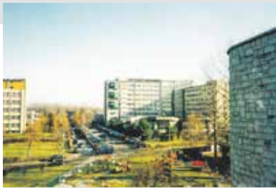
fol. mat. GCZD

Po ponad 30 latach od powstania koncepcji budowy specjalistycznego szpitala dla dzieci z naszego regionu, 29 maja 1999 roku odbyło się uroczyste,